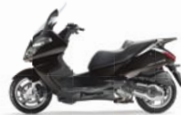
Moka Black 250.125