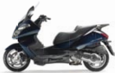
Couture Blue 500.250.125