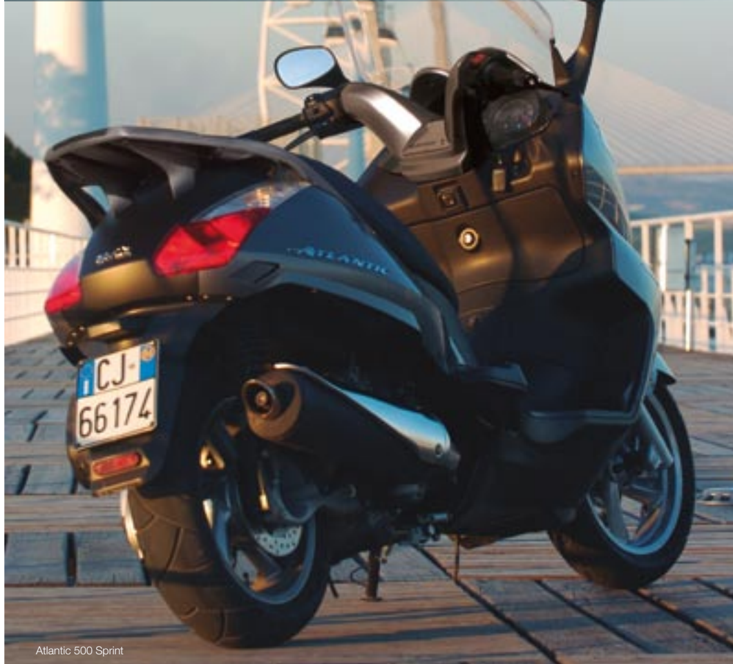
Atlantic 500 Sprint