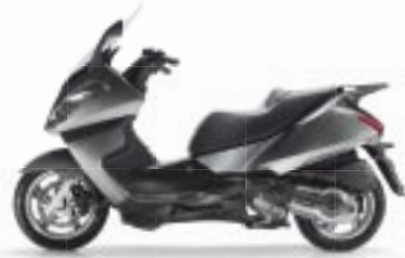
Shot Grey 500.250.125