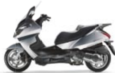
Excalibur Grey 500.250.125